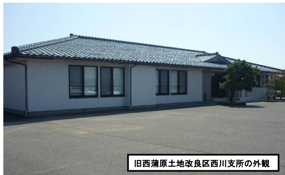
旧西蒲原土地改良区西川支所の外観