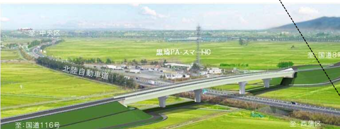
【イメージパース】黒埼工区(北陸道跨道橋)