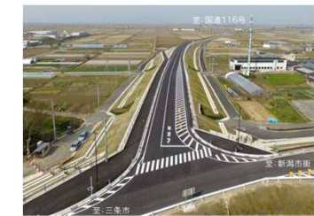
【写真】中ノ口工区(部分供用区間)