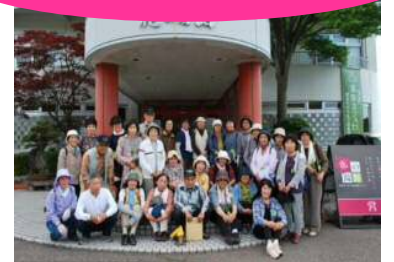
リニューアル後お披露目ご招待