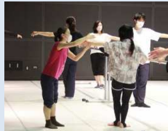
市民のためのオープンプラス