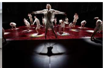
2021年7月 Noism0 + Noism1 + Noism2 『春の祭典』