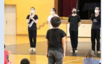
Noism2学校公演 質問コーナー