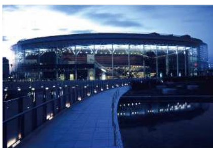
りゅーとぴあ 新潟市民芸術文化会館

日本初の公共劇場専属舞踊団として2004年4月りゅーとぴあ新潟市民芸術文化会館で設立。芸術監督は、りゅーとぴあ舞踊部門芸術監督でもある金森穰。プロフェッショナル選抜メンバーによるNoism0（ノイズムゼロ）、プロフェッショナルカンパニーNoism1（ノイズムワン）、研修生カンパニーNoism2（ノイズムツー）の3つの集団があり、2004年の設立以来、国内・世界各地からオーディションで選ばれた舞踊家が新潟に移住し、年間を通して活動しています。Noism1はりゅーとぴあで創った作品を国内外で上演し、新潟から世界に向けてグローバルに活動。Noism2はプロをめざす若手舞踊家が所属し、劇場での公演の他に、新潟市内で開催されるイベントや学校への出前公演等、地域に根ざした活動を続けている。Noism0は、舞踊に限らず、年齢と経験を積み重ねた芸術家だからこそ生み出せる表現を、新潟から世界に向けて発信しています。