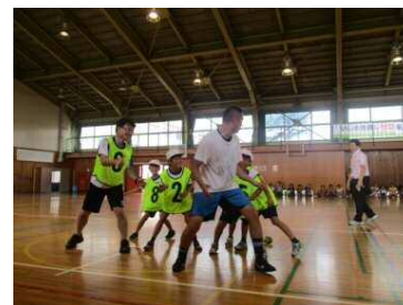
脳性麻痺のある方とのサッカー交流