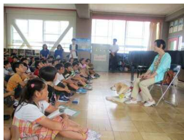
ゲストティーチャーの講演