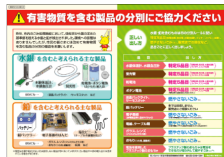
(裏面) 有害物質を含む製品の分別協力をお願い