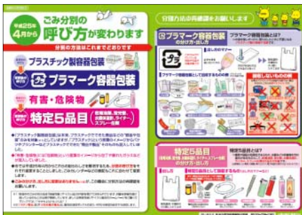
(表面) 分別呼称変更のお知らせ