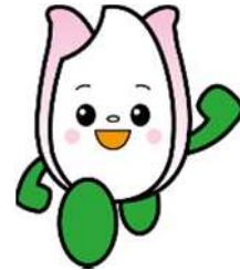
新潟市食育・花育推進 キャラクター まいかちゃん

現在参加者を募集しておりますので、取材・広報にご協力 いただきますようお願いいたします。