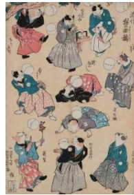
左：錦江斎春舛「墨摺報条 風流曲手まり」（部分）個人蔵 右：歌川国芳「流行猫の曲鞠」個人蔵