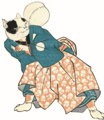
歌川国芳「流行猫の曲鞠」(部分) 個人蔵