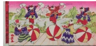
上：「新版玉のり尽」（部分）個人蔵 下：歌川国利「新版猫の玉のり」（部分）個人蔵