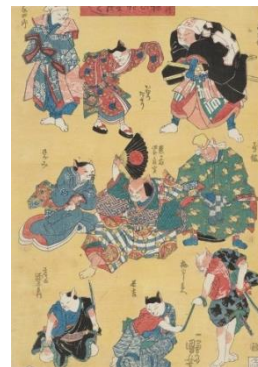
歌川国芳「流行猫の狂言づくし 熊ヶ谷次郎直実ほか」個人蔵

いかに対象を観察し、描くか。そしてアイデアをどのように膨らませ、形にしていくか。「百面相」で培われた画才は、そのまま猫の戯画にも結実しています。国芳の観察力や的確な表現力とともに、次から次へとあふれでるユーモラスなアイデアをお楽しみください。