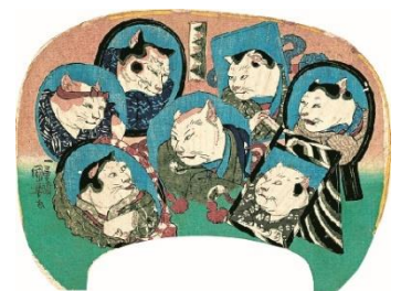
歌川国芳「猫の百面相 忠臣蔵」個人蔵

天保12年（1841）、歌川国芳による団扇絵（うちわえ）「猫の百面相」が流行します。猫を人のように描くのではなく、実在する人間の歌舞伎役者を猫に見立てて描くという趣向は、これまでにない新機軸でした。こちらは「もしも、あの有名人が猫になったら？」というアイデアが起点になったものといえるでしょう。