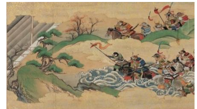
「鶏鼠物語絵巻貼付屏風」（部分）名古屋市博物館蔵

擬人化世界の入り口としてまず、人ならぬものが主役の異類物(いるいもの)を、つづいて昔ばなしや戯画、風刺画など、江戸時代から明治時代にかけての擬人化作品を紹介していきます。