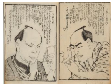
花笠文京填詞・歌川国芳画『写生百面叢』 名古屋市蓬左文庫蔵（尾崎久弥コレクション）

『朧月猫の草紙』や「猫の百面相」を発表する少し前から、国芳は「百面相」なる絵を手掛けるようになります。表情だけでその人がどのような状況に置かれているのかを滑稽に表したものです。「猫の百面相」との関係を探りつつ、国芳の「百面相」を見ていきます。