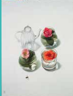
五味文彦《あかいはな》2010年 油彩