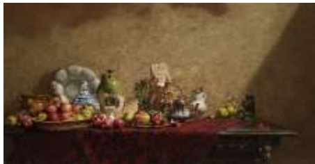
青木敏郎《秋の恵み ザクロ・カリン・ 各種の器》2020年 油彩