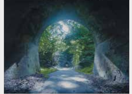
岩下慎吾《光をあつめて》2019年 油彩