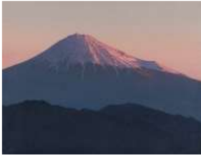
羽田裕《黎明富士》2019年 油彩