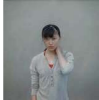
三重野慶《信じてる》 2016年 油彩