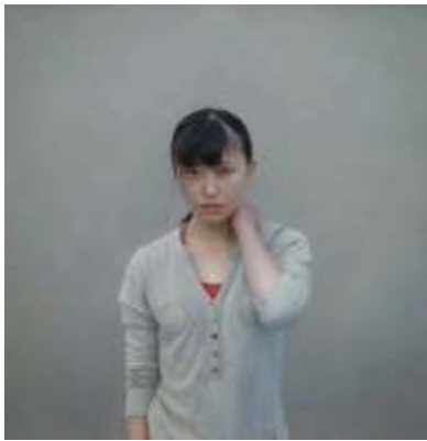
三重野慶《信じてる》2016年 油彩