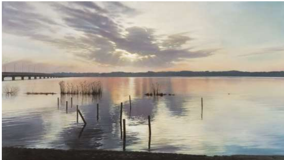
大畑稔浩《仰光一霞ヶ浦》2008年 油彩