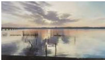
大畑稔浩《仰光一霞ヶ浦》 2008年 油彩