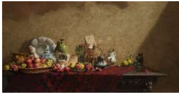
青木敏郎《秋の恵み ザクロ・カリン・各種の器》2020年 油彩

ホキ美術館は千葉市緑区に2010年11月に開館した、世界でもまれな写実絵画専門美術館です。