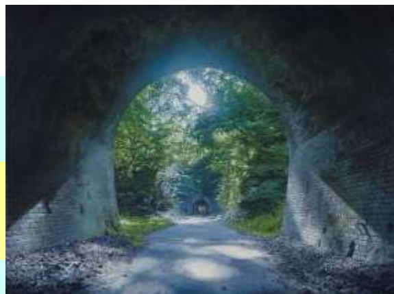
岩下慎吾《光をあつめて》2019年 油彩

手触り、匂い、空気感までもが表現されており、 感覚に訴えるその表現は写真よりもリアル。 否、実物より真に迫ると言っても過言ではありません。