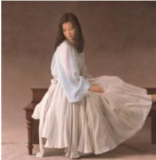
森本草介《未来》2011年 油彩