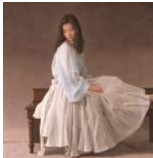
森本草介《未来》 2011年 油彩