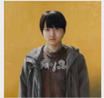
中西優多朗《次の音》2019年 油彩