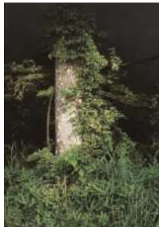
五味文彦《木霊の囁き》 2010年 油彩