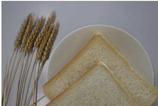
2023年春の商品（食パン）