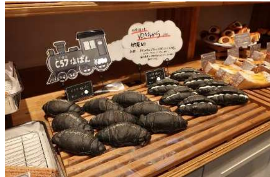
2023年春の商品（C57塩パン）