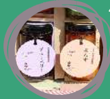
タカツカ農園 ジャムセット