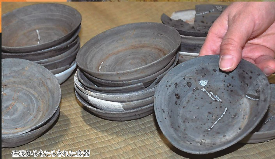
佐渡からもたらされた食器