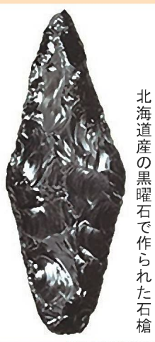
北海道産の黒曜石で作られた石槍