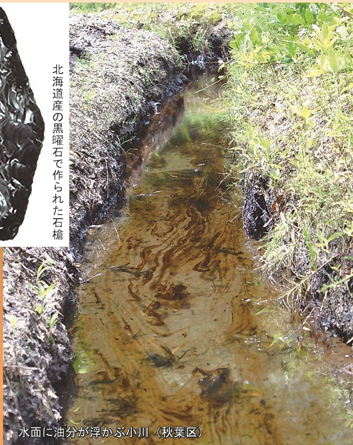
水面に油分が浮かぶ小川（秋葉区）