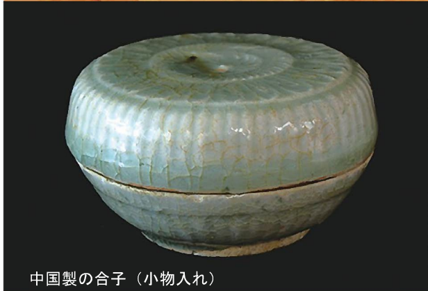
中国製の合子（小物入れ）