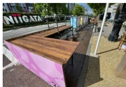
新潟駅前ストリートテラス