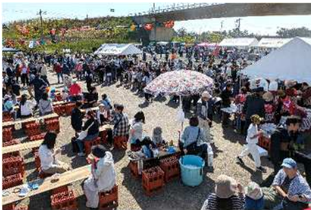
「新川漁港大漁祭」の様子

このたび新潟市が中心となり、新川漁港（西区）において将来に向けた新川漁港の活性化や有効活用を図っていくため、地域の皆さまとともに考え、取組につなげる「新川漁港活性化協議会」を設立します。