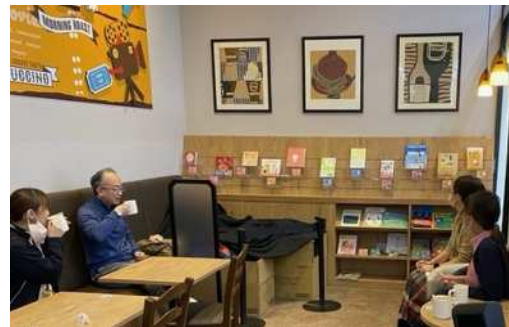
スターバックスコーヒーやタリーズコーヒーでも開催しています（中央区・西区）