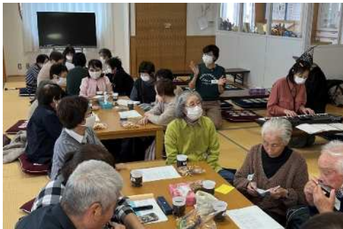
より道カフェかけ橋