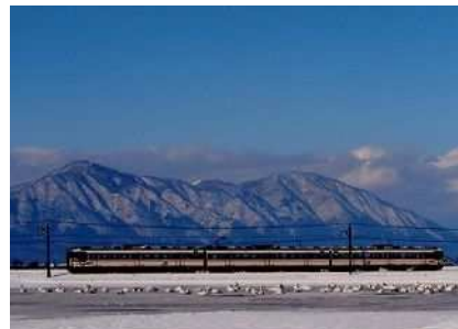
令和5年度応募作品