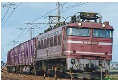
令和5年度応募作品