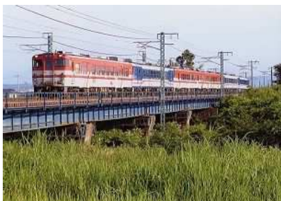
令和5年度応募作品