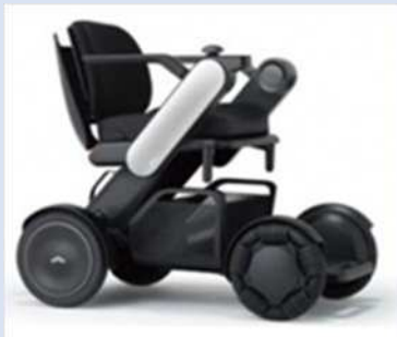
WHILL(株)「WHILL Model C2」