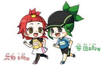
「マンガ・アニメのまち にいがた」サポートキャラクター