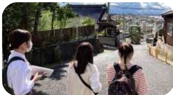
新潟青陵大学生による「しもまち地域」のまち歩きコースとフリーペーパーづくり