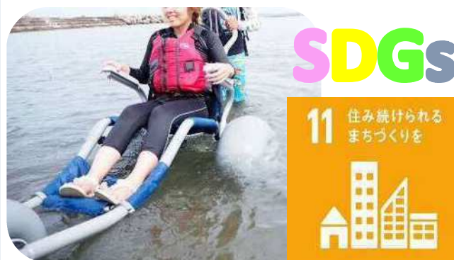
砂浜用車イスで浜辺に必要なバリアフリー整備等を検証