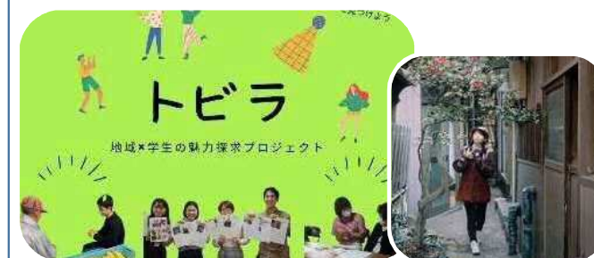
県外学生が「しもまち地域」に滞在しながら体験活動

【お問い合わせ先】 新潟市中央区地域課長 大倉 電話025-223-7023(直通)