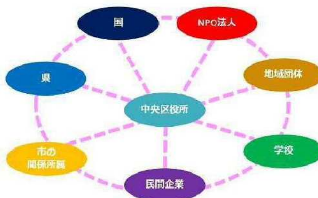
多様な主体によるネットワーク起ち上げ