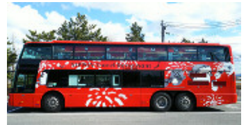
レストランバスイメージ