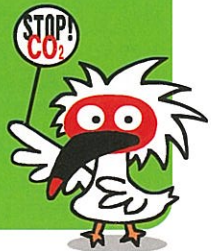
新潟市地球温暖化防止 イメージキャラクター「とめどきくん」 Character design : Ga2Ga4

マイボトルの利用や家庭での省エネ チェックで地産地消品などの景品が 当たる抽選に応募できます。 楽しくエコなライフスタイルを!