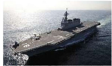
護衛艦「ひゅうが」 7/14~16 / 東港・東埠頭