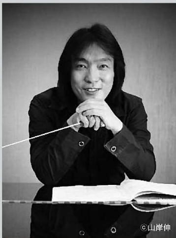
飯森範親(指揮) IIMORI Norichika conductor

桐朋学園大学指揮科卒業。ベルリンとミュンヘンで研鑽を積む。1994年から東京交響楽団の専属指揮者、2004年9月、正指揮に就任。同年より山形交響楽団の常任指揮者、07年音楽監督に就任。06年度芸術選奨文部科学大臣新人賞。その他にも国内外を問わず、数々のオーケストラを指揮。01年、音楽監督に就任したドイツ・ヴュルテンベルク・フィルハーモニー管弦楽団と「ベートーヴェン交響曲全曲」のCDをリリースしている。14年4月から、日本センチュリー交響楽団首席指揮者に就任。