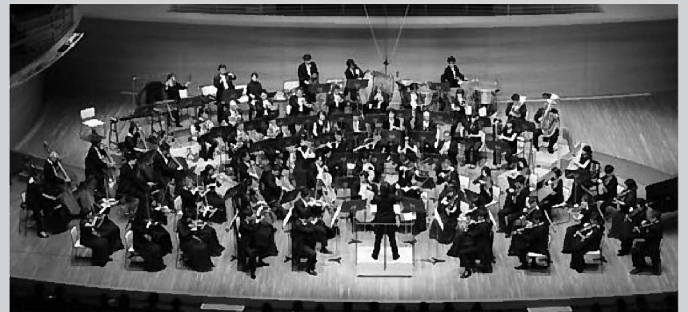
東京交響楽団(オーケストラ) Tokyo Symphony Orchestra

1946年創立。2104年度シーズンよりジョナサン・ノットが第3代音楽監督に就任。98年から新潟市と提携を結び、準フランチャイズ・オーケストラとして定期演奏会を年6回、新潟市民芸術文化会館で開催している。新潟ではコンサートホールでの演奏活動の他、ホワイエでの「ロビーコンサート」、新潟市内の小中学校への訪問授業なども積極的にを行っている。www.tokyosymphony.jp