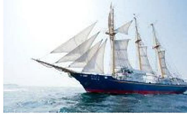
帆船「みらいへ」 7/21~22 / 西港・山の下埠頭