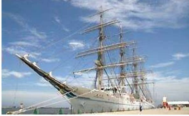
練習帆船「海王丸」 7/21~22 / 西港・山の下埠頭