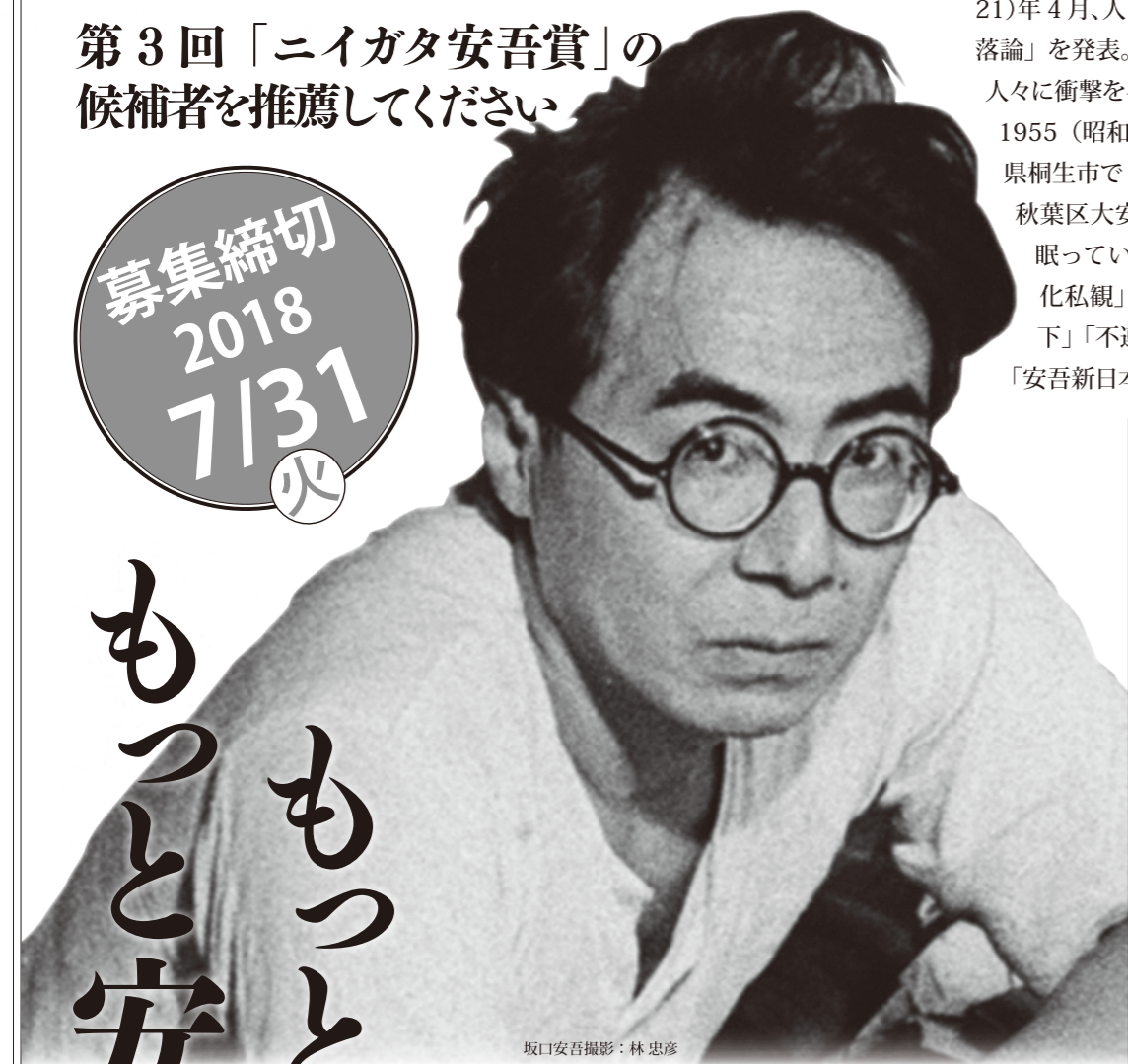
坂口安吾

坂口安吾は 1906（明治 39）年 10 月、新潟市西大畑町に生まれる。1931（昭和 6）年に発表した「風博士」、「黒谷村」で新進作家として認められ、1946（昭和 21）年 4 月、人間の本質を鋭くえぐった「墮落論」を発表。焼け跡の廃墟にたたずむ人々に衝撃を与えた。