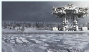
マーク・フォスター・ゲージ 《グッゲンハイム・ヘルシンキ美術館》CG映像、2014年、Image courtesy of Mark Foster Gage Architects