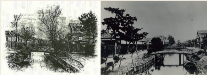
バードのスケッチをもとにした堀の絵(左、『市史にいがた3』より転載)と明治初期の西堀の様子(右)。堀には橋が架けられ、岸が整備されている。

分水通水による水量の減少で、水質が悪化していきました。新潟の堀は、「柳都新潟」を形づくるとともに、人々の生活に密着したものでした。