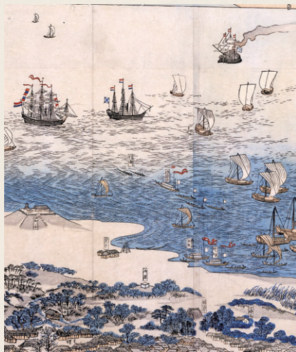
沖合に停泊した外国船を、水先案内の「引船」2艘と応接船、3艘の役人の船が出迎える(「新潟湊之真景」新潟市歴史博物館蔵)

ジギット号の報告によれば「上陸して街へ行こうとする私たちを、新潟奉行所の役人たちは言葉と合図で食い止めようとしたが失敗した。新潟の人々は外国人を一目見ようと群れを成して集まってきた。前進する我々に対し、付添人と化した役人たちは町人たちを追い払い、家や店を閉めるように命ずるなど、我々の散策の目的を妨害した」とあり、初めてのの上陸は混乱の中進んだのでした。