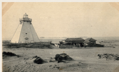
【3代目の白い六角灯台】