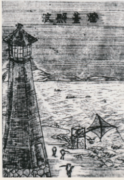
【2代目の黒い六角灯台】 明治13年「新潟沿革図」より

新潟港の灯台の歴史の中で存在期間が最も短かったのが2代目灯台です。明治10(1877)年に新潟県が船見町2丁目に設置した黒色の六角灯台でした。しかし、灯台の管轄が県から国に移管されたため、わずか5年で3代目灯台に建て替えられました。この灯台は、残っている資料が少なく詳細は不明です。明治13年に描かれた絵図面などからその姿をしのぶことができますが、まさに幻の灯台ともいえるのです。