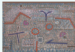
パウル・クレー「ブルンのモザイク」1931年 新潟市美術館蔵