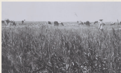
臨港埠頭建設前の牧場の様子(大正時代前期)