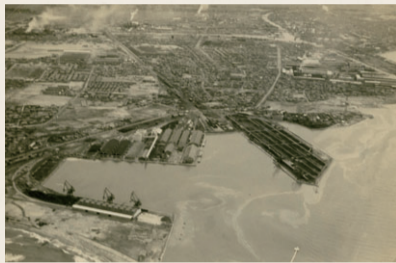
建設中の臨港埠頭(大正時代後期)