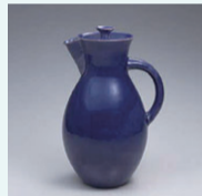
オットー・リンディッヒ「ココアポット」1923年 宇都宮美術館所蔵