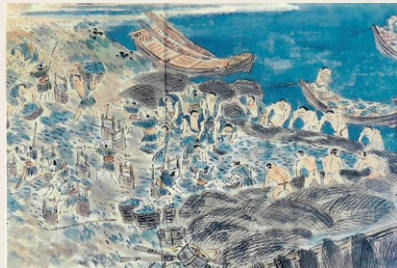
資料2 イワシ漁と干鰯づくりの様子(「西蒲原郡五十嵐浜村 鰯漁及干鰯船積之図」(部分))