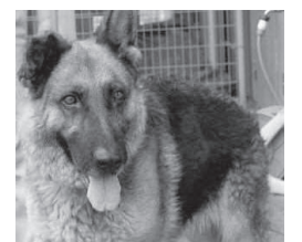
▲譲渡対象の犬(シェパード、雌、推定7歳、体重約30キロ)

※申込書は申込先、区役所区民生活課(中央区は窓口サービス課)で配布。市HPにも掲載。譲渡対象動物がない場合は譲渡前講習のみ開催