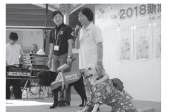
▲盲導犬体験歩行紹介