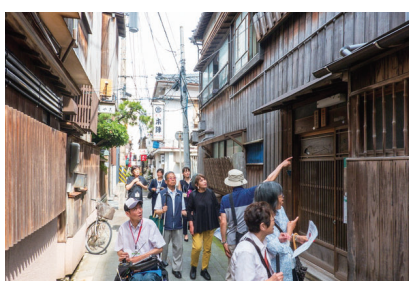
障がい者ガイドによるまち歩き体験の様子

障がいがあるからこそ気付くまちの魅力が伝えたい。モトクロスバイクの事故で頸髄を損傷した影響で、普段から電動車椅子を使用しています。今回のイベントは障がい者のことを一般の方に知ってもらいたいという機会だと思いい、「まち歩きガイド」として参加することを決めました。改めて自分で古町のまちを巡ってみると、昔あった路面の段差がなくなっていたり、車椅子では無理だと思っていたお店や施設に入ることが分かったりと、今まで知らずにいたまちの様子に気付くことがあります。また、古い建物の外壁の手触りや芸妓さんが踊りを練習する三味線の音など、障がいのある無にかかわらずみんなが楽しめる魅力がたくさんあるので、ぜひ実際に感じてほしいです。