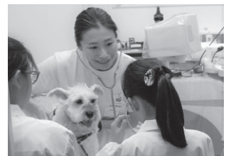
▲獣医師の仕事体験