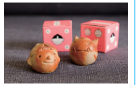
▲備前焼「ももたま」関谷ワークセンター・せと(岡山県)

日 9/15(日)～11/29(金) 8:30～17:30 ※日曜は10:00～15:00。土曜、祝・休日は休み