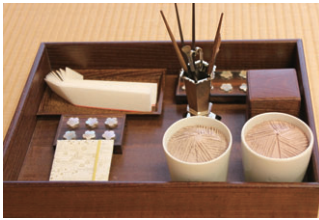
乱箱(香道具を入れる箱)

お香とは自然の香りとは別に、物に火を付けたり温めたりして発生させた香りのことです。その匂いを鑑賞することを「香道」といいます。香道は茶道や華道と並ぶ「日本の三大芸道」と呼ばれ、室町時代から今日まで約500年の歴史を持つ伝統文化です。