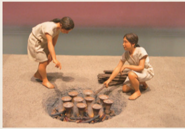
出山遺跡製塩炉模型 (新潟市歴史博物館 常設展示より)