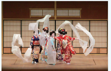
11月10日開催 日本舞踊の祭典

同文化祭は11月末をもって閉会となりました。ご協力、ご参加いただいた皆さま、誠にありがとうございました。