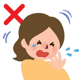
せきやくしゃみを 手で押さえる