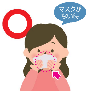
ティッシュ・ハンカチで 口・鼻を覆う