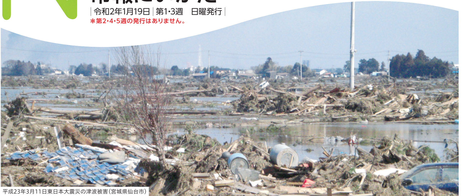
平成23年3月11日東日本大震災の津波被害(宮城県仙台市)

| 令和2年1月19日 | 第1・3週 日曜発行 | * 第2・4・5週の発行はありません。