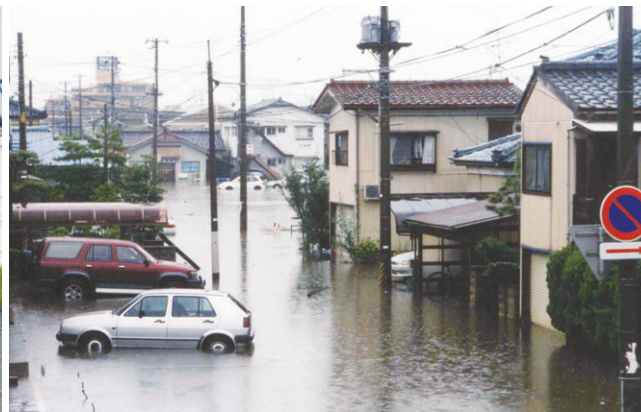
平成10年8月4日8.4水害(新潟市中央区)