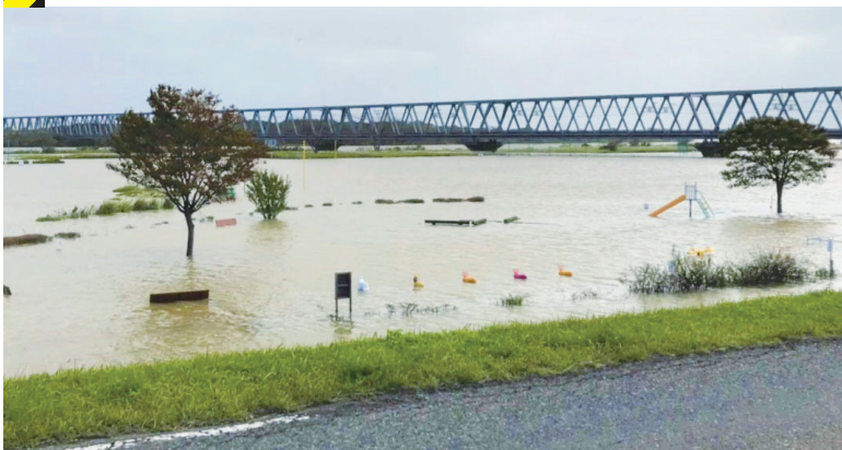
令和元年10月12日台風第19号通過後の阿賀野川(新潟市北区)

大津波で多くの命が奪われた東日本大震災から9年がたとうとしています。近年、多くの災害が発生しています。災害はいつ起きるか分かりません。いざというときに「自分の命は自分で守る」ための行動ができるよう、日頃から準備をしておく必要があります。今号では津波と洪水などを中心に「防災」を特集します。 問 防災課(☎025-226-1143)