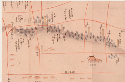
「新潟海浜松苗木植付場所図」(部分、新潟市歴史博物館蔵) 修就が植林を行った様子を描いている