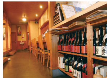
和楽亭 澤(中央区女池神明1)の店内。常連客のボトルが並ぶ