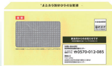
▲市が発送した封筒

給付を希望する人でまだ手続きが済んでいない場合は、忘れずに申請してください。返送する前に、記載内容と添付書類を必ず確認してください。申請書が届いていない人は至急問い合わせてください。