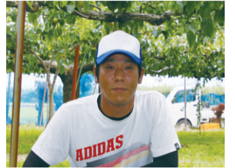
▲日本ナシのほか、西洋ナシ「ルレクチエ」も栽培しています

「8月から12月まで、その時の旬の品種がお店に並びます。品種ごとに個性が違うので、ぜひ品種ぞろえが変わるごとに味わってほしいですね」と笑顔で話してくれました。