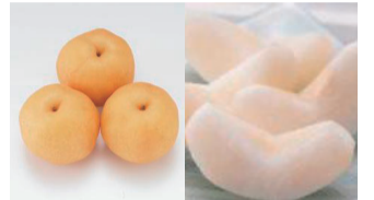
▲幸水を保存する場合は冷蔵庫の野菜室へ。ほかの品種は日陰で常温保存。1週間以内に食べましょう。写真は新高