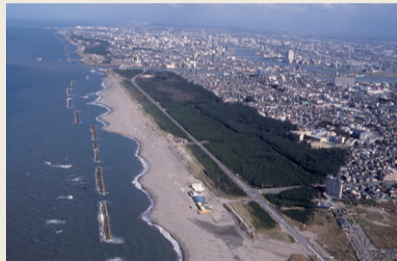
現在も海岸沿いに広がる松林は「日本の白砂青松100選」に選ばれている(写真は中央区関屋付近)