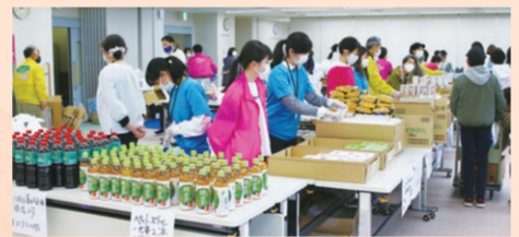
▲4月25日に市母子福祉連合会と行った食料配布イベントの様子

同法人では、寄付された食品を生活困窮者支援団体などへ提供することで、生活困窮者への支援や食品ロスの削減などを目標としています。