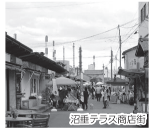
沼垂テラス商店街