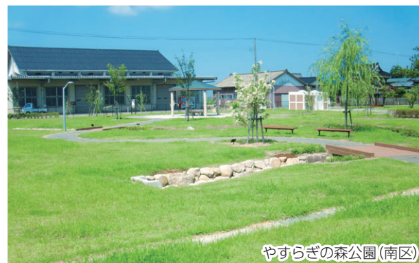
やすらぎの森公園(南区)