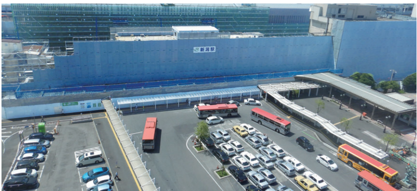
▲東大通り側から駅舎方向を望む(7月1日撮影)

来年の春ごろまでをめどに旧駅舎の撤去工事を実施しています。現場付近の安全確保に協力をお願いします。