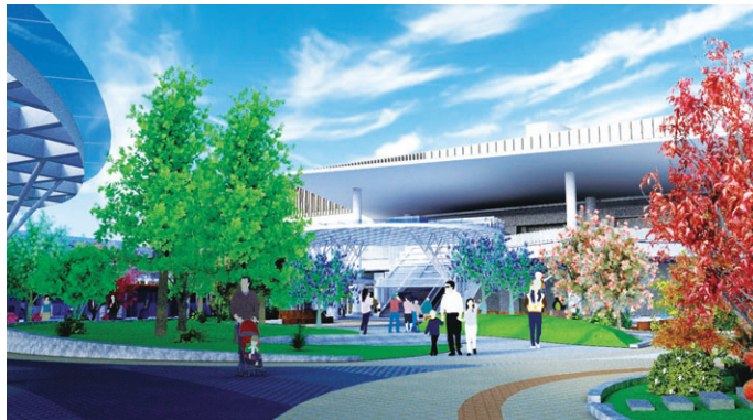
▲広場中央付近から駅舎方向を望む