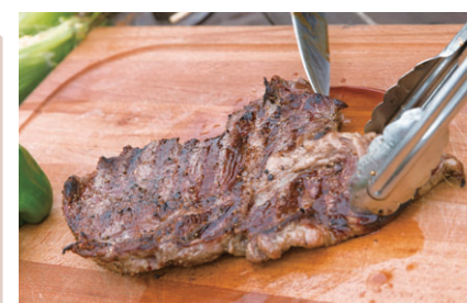
1ポンドステーキセット