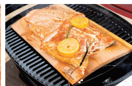
プランクサーモンセット