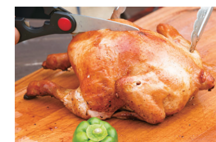
ローストチキンセット