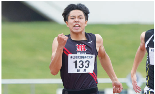
将来の夢/世界で活躍する選手になる 得意な科目/日本史

スポーツなどに取り組む高校生を紹介します。 問 学校支援課(☎025-226-3263)