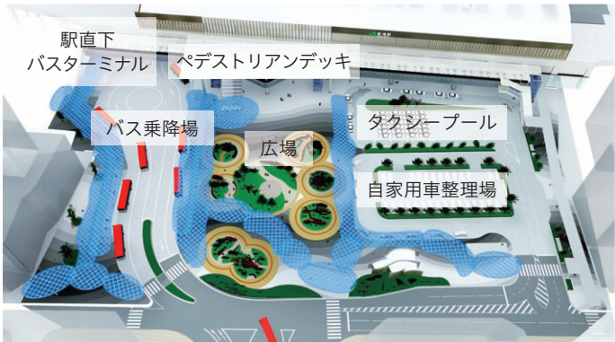
▲東大通り上空から望む