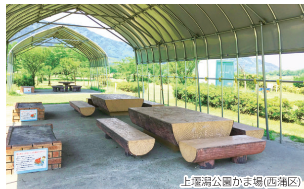
上堰湯公園かま場(西蒲区)