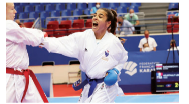
▲レイラ・エルト選手 (女子組手61kg級) 2018年KARATE1プレミアリーグラバト大会優勝