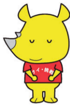
新潟市ごみ減量推進キャラクター「サイチョ」