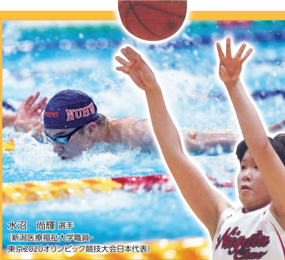
水沼 尚輝 選手 (新潟医療福祉大学職員・ 東京2020オリンピック競技大会日本代表)