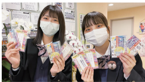
選手に渡す記念品