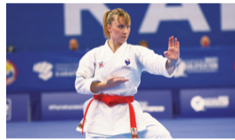
▲アレクサンドラ・フェラッチ選手 (女子形) 2018年世界空手道選手権大会第5位