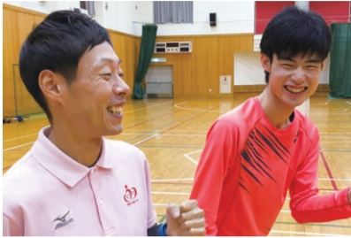
勤務中は利用者と笑顔で触れ合う

障がいのあるトップアスリートが世界一を懸けて争う東京2020パラリンピック競技大会が間もなく開幕します。事故で右腕に障がいを負いながらも、新潟から金メダルを目指して走り続ける選手に意気込みを聞きました。 問 スポーツ振興課(☎025-226-2601)