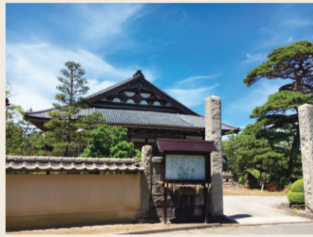
現在の西遊寺。 現存する本堂は明治11(1878)年建築のもの

このような人の移動に伴った寺院の移転は、主に近世初期に盛んでした。戦乱や浄土真宗への弾圧から逃れるためなど理由はさまざまでしたが、他国からの人の流入・定住は蒲原平野の開発や村落形成の発展に大きな影響を及ぼしました。