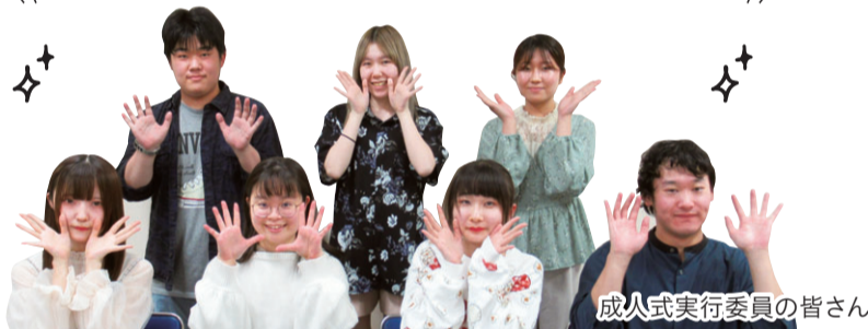
成人式実行委員の皆さん

当日は感染症対策をしっかり行って、会場に来てください。YouTubeは誰でも見ることができます。ぜひ見てください。