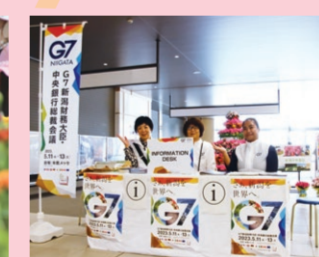
新潟駅と新潟空港で会場・観光案内