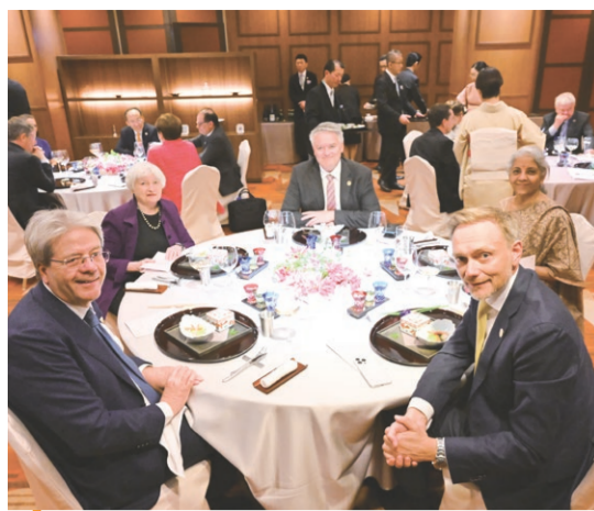
8 会議2日目に開かれた夕食会で、新潟漆器で提供された食事を楽しむ各国関係者