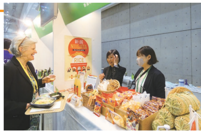
6 プレスセンターで各国の報道陣に新潟の食を提供

各国の関係者に県内の日本酒を紹介しました。日本酒好きの人が多くて、とても驚きました。