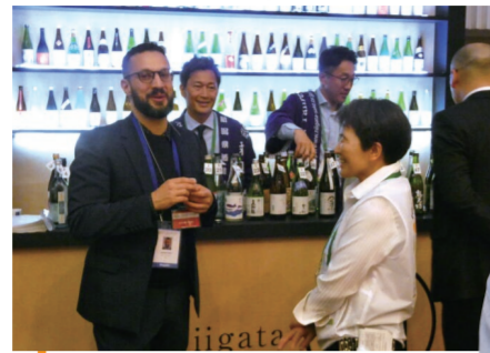
7 日本酒バーで県内約90の清酒蔵元の地酒を提供