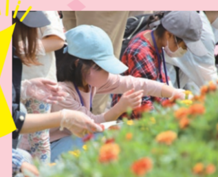
新潟駅南口広場での花の植え込み