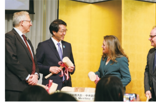
2 新潟の地酒を使った鏡開きで各国大臣らと言葉を交わす中原市長