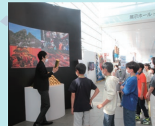
会場見学ツアーで会議の雰囲気味わう