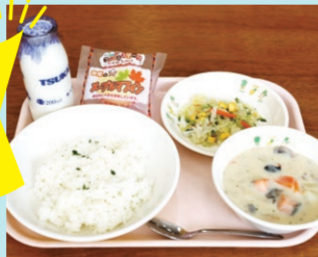
サミット給食(カナダ料理をイメージ)