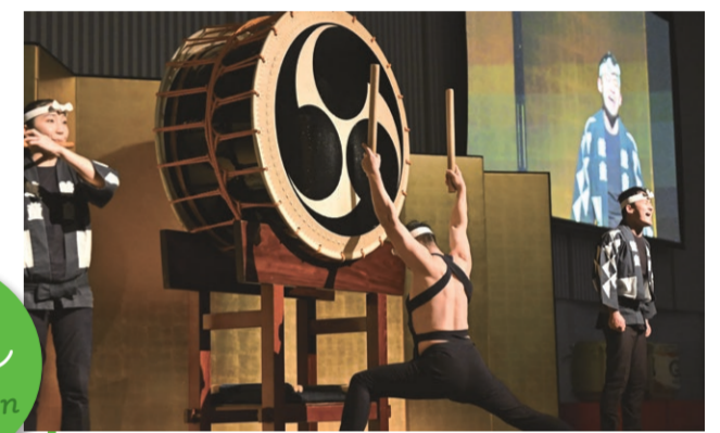
4 太鼓芸能集団「鼓童」による和太鼓演奏