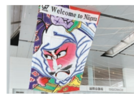
9 白根の大凧や下町のまといなどを展示し会場を装飾