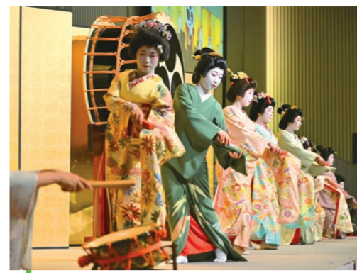
3 古町芸妓が舞を披露