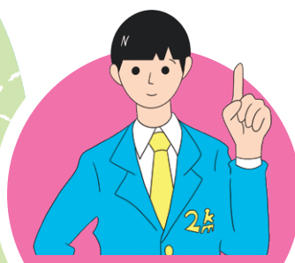
ニイガタニキロー まち歩きが趣味の 新潟市職員