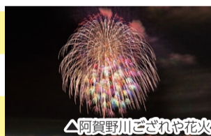
△阿賀野川ござれや花火