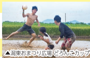
△潟東おまつり広場 どんこカップ