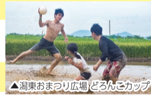
▲潟東おまつり広場 どんこカップ