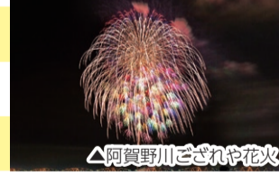
▲阿賀野川ござれや花火