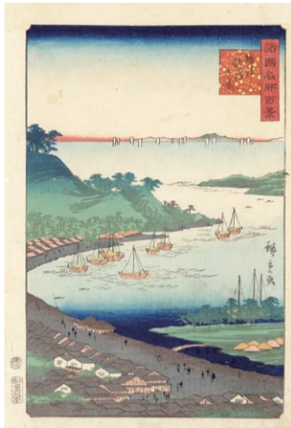
▲諸国名所百景 越後新潟の景

会期 7月27日(土)～9月1日(日) ※土曜11時にギャラリートークを実施 観覧料 一般500円、高校・大学生300円