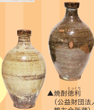
▲焼酎徳利 (公益財団法人鶴友会所蔵)