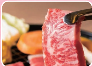
キラキラレストラン焼肉黒真 こだわりの国産焼肉に舌鼓