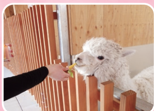
動物ふれあいセンター 餌やり体験でアルパカと触れ合う