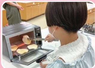
食育・花育センター 新潟産食材を使った料理体験