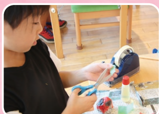
こども創造センター 新聞紙工作に挑戦