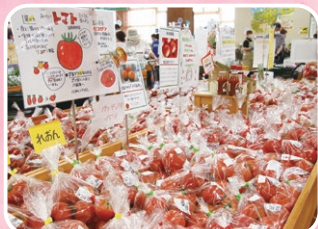
キラキラマーケット 地元の農産物を購入