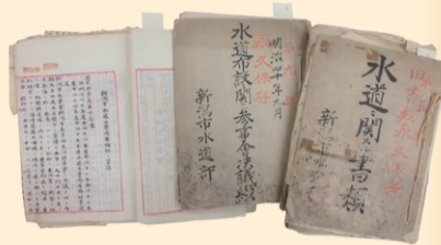
新潟市上水道敷設関係資料

享保15(1730)年に開削された松ヶ崎堀割(現在の阿賀野川河口部)と決壊後の堀割の様子を絵図。現在の阿賀野川の形になる様子を知ることができる。