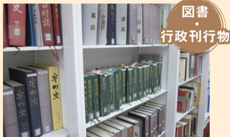
図書・行政刊行物