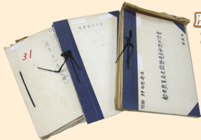
歴史資料として重要な公文書

市役所で作成された文書のうち保存期間が終了し同館へ移管されたものや、個人や団体から寄贈を受けた文書など、新潟市政を検証するために後世に残すべき重要な文書