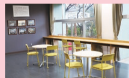
▲エントランスホール