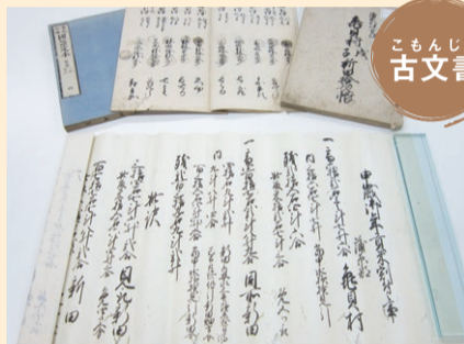
こもんじょ古文書