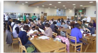
健康食を食べよう(構成団体他施設)