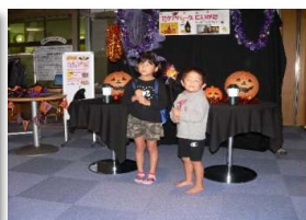
ハロウィンイベント