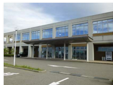
長く市民に親しまれる施設であるために