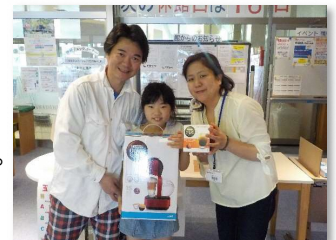
父の日ガラポン大会