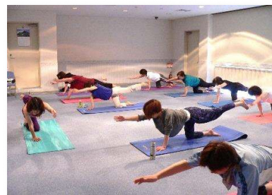
多様な健康教室の実施