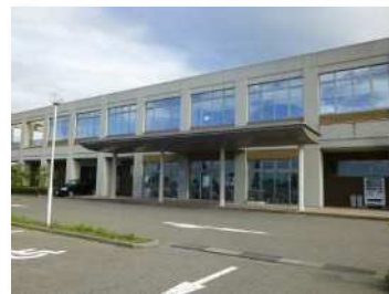
長く市民に親しまれる施設であるために