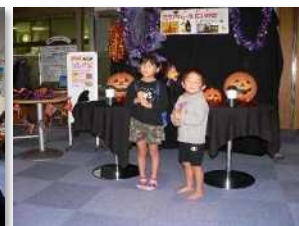
ハロウィンイベント