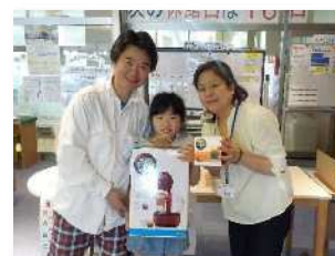
父の日ガラポン大会