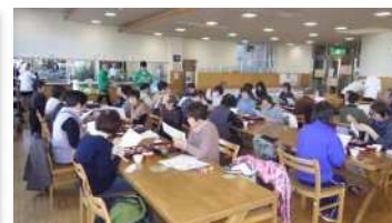
健康食を食べよう(構成団体他施設)