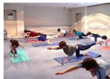
多様な健康教室の実施