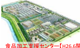
食品加工支援センター【H26.6開設】