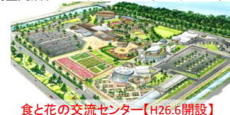
食と花の交流センター【H26.6開設】