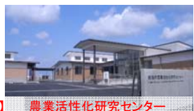
農業活性化研究センター