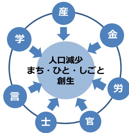
新潟市まち・ひと・しごと創生会議

⇒ 地方創生及び人口減少の克服には、行政のみならず民間の多様な主体の協働が重要 それぞれの立場での取り組みを紹介し合うなど、「対話の場」としても位置付け