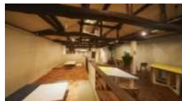
古民家を活用した 小さな複合施設