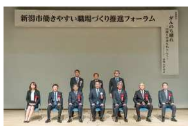
働きやすい職場づくりに取り組む企業の表彰