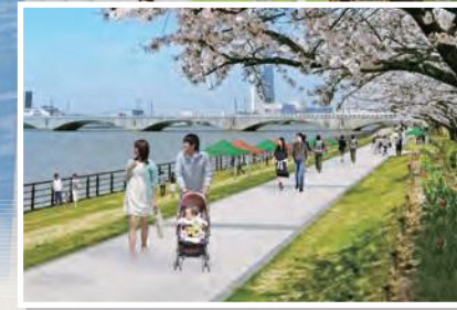
やすらぎ堤から萬代橋方面を望む