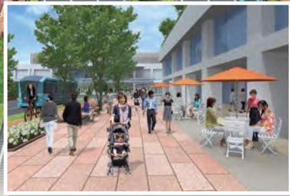
東大通りから新潟駅方面を望む