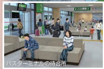
バスターミナルの待合所

新潟市の玄関口に相応しいビジネス拠点として 高度な機能と風格を備えた都市空間を形成