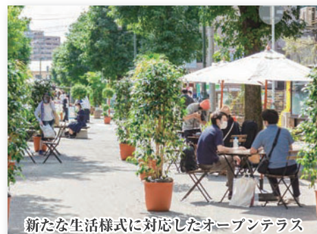
新たな生活様式に対応したオープンテラス