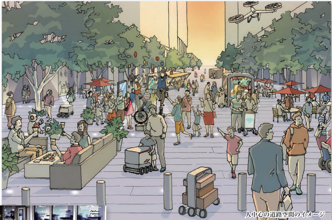
人中心の道路空間のイメージ

道路空間の再構築を進め、都市緑化と共に回遊性の向上による人中心のストリートを形成