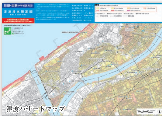
津波ハザードマップ