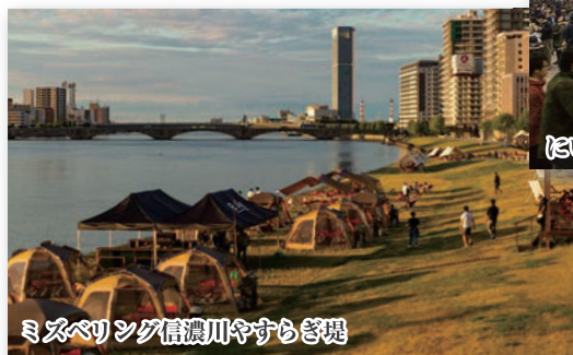
ミスベリツグ信濃川やすらぎ堤