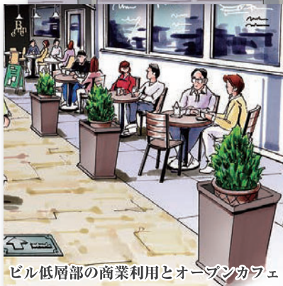
ビル低層部の商業利用とオープンカフェ