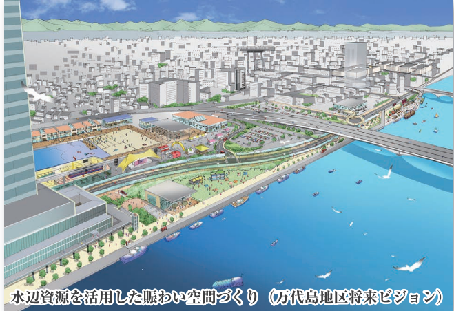
水辺資源を活用した賑わい空間づくり (万代島地区将来ビジョン)