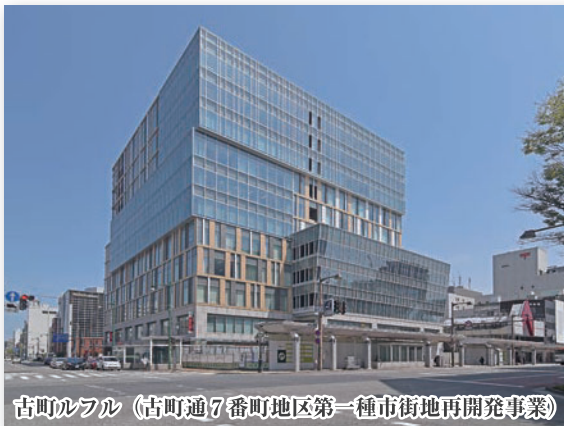
古町ルフル (古町通7番町地区第一種市街地再開発事業)