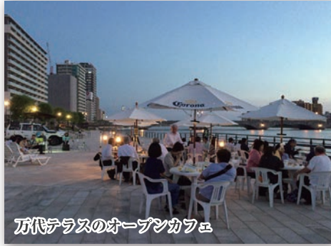
万代テラスのオープンカフェ