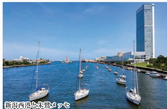
新潟西港と朱鷺マッセ