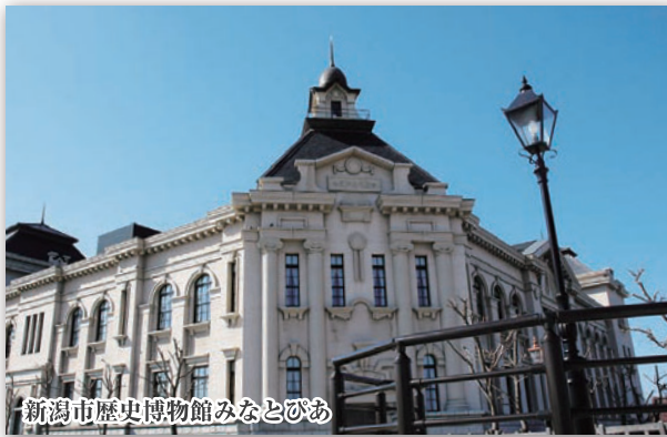
新潟市歴史博物館みなとびあ